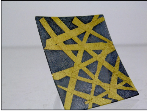
Ring Silber 925/000 mit 24 kt Feingoldbeschichtung in Keum- Boo Technik