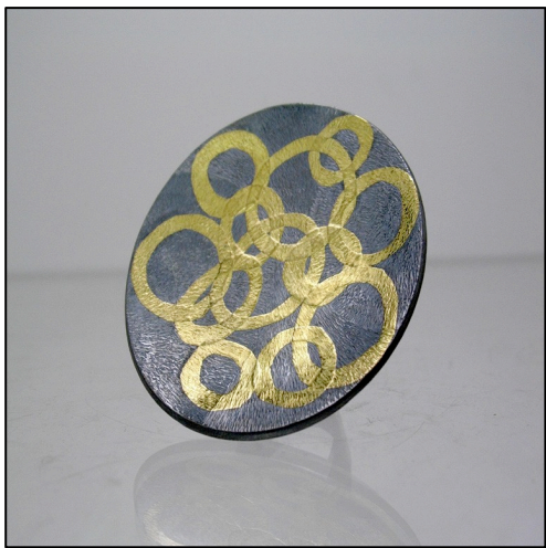
Ring Silber 925/000 mit 24 kt Feingoldbeschichtung in Keum-Boo-Technik